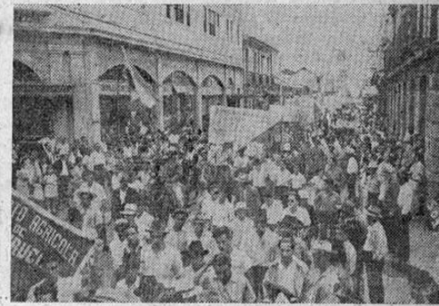
El desfile llegando al Parque Morazán.