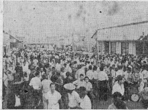
En la Plazoleta del Pacífico, cuando apenas la muchedumbre comenzaba a organizarse