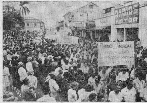
Al pasar el desfile frente al Parque Central. La multitud de cartones cubre la perspectiva sobre la calle hacia la plazoleta del Pacífico.

El 1º de Mayo demostró la clase trabajadora de Costa Rica su fuerza, su espíritu de combate, su magnífica organización y su profundo sentido de responsabilidad, dándole a la reacción uno de los golpes más certeros de los últimos tiempos. Hasta los más recalcitrantes enemigos suyos no han tenido más remedio que decir que la manifestación del Día del Trabajo fué la evidencia misma de la potencia de la Confederación de Trabajadores de Costa Rica y de la justeza de la línea de acción de sus dirigentes. Todos los costarricenses que tienen claro sentido del patriotismo, de su conciencia de clase, de su fervoroso anhelo de hacer de su Patria un país sin hambre, ni esclavitudes ni miserias, como un solo hombre se situaron bajo las ban-