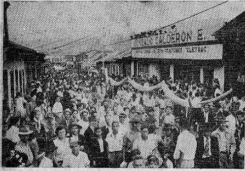
En esta gráfica vemos la nota sobresaliente del desfile: una cabeza con una enorme lengua de 50 metros simbolizando a la prensa venal y mentirosa de la reacción.—Son tan lengua-larga estos señores de la reacción que hoy andan por los Estados Unidos en su vil tarea de calumniar al movimiento obrero.

CRONICA DETALLADA DE LA APOTEOSICA, TRIUNFAL Y BRILLANTE MANIFESTACION CELEBRADA POR EL PUEBLO BAJO LAS BANDERAS DE LA CONFEDERACION DE TRABAJADORES DE COSTA RICA Y DE VANGUARDIA POPULAR